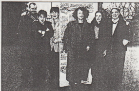
Het Achterwerk in de kast-team met de Kast